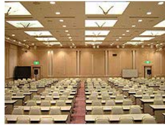
ホールA B : BからAを望む