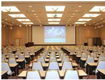
ホールA B : AからBを望む