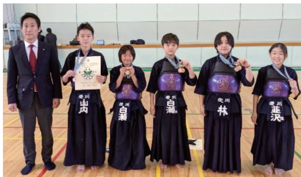
団体戦 愛川剣道教室 (愛川町)

神奈川の選手、団体5名、個人2名の7名はコロナ禍でもあきらめることなく日々稽古に励んできました。全国交流大会ではその稽古の成果をしっかりと出し切って自分たちらしい元気いっぱいの試合をしたいと思います。